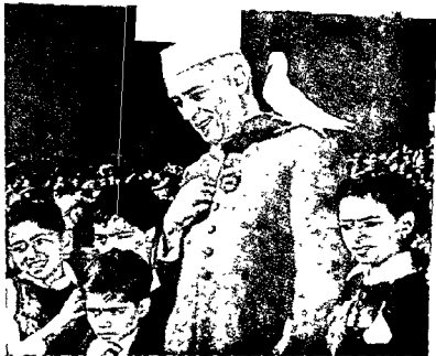
The messenger of peace (Song 73)